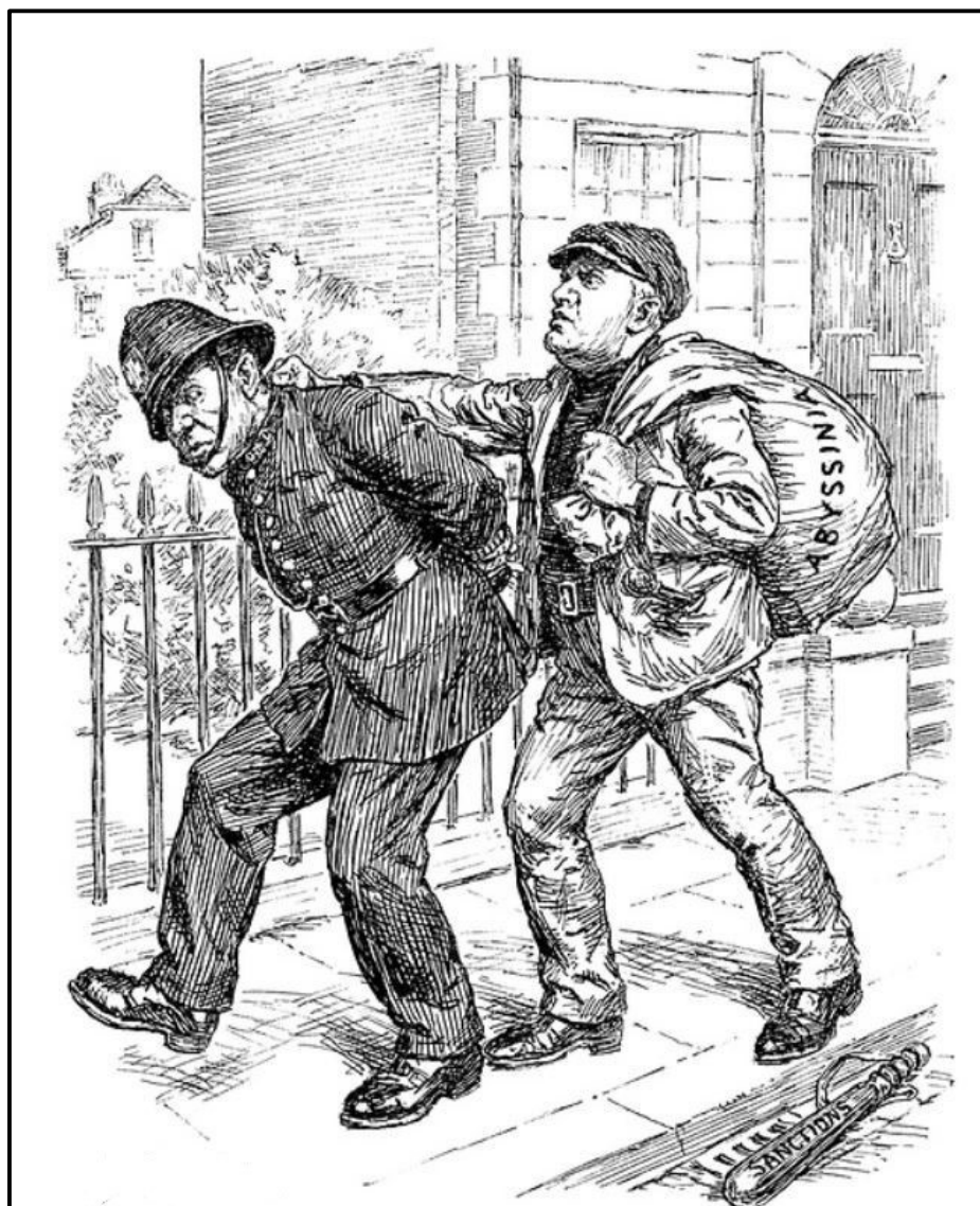
The League as Some Would Like to See it.

The following cartoon was published in 1936.